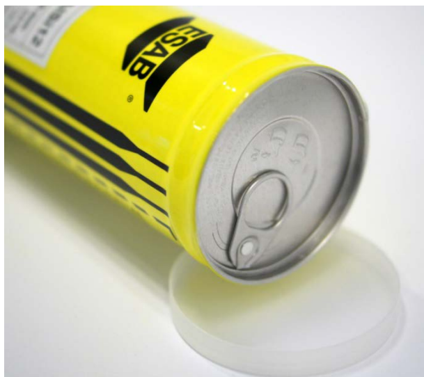
Obal tvoří hliníkový tubus se snadno otevíratelným víčkem