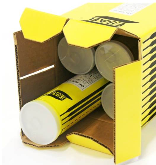
Hliníkové tubusy jsou po čtyřech kusech uloženy do papírového kartonu.