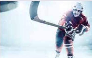
METZ 64xx THE DIRECT ONE