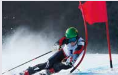
METZ 59x THE ACCESSIBLE ONE