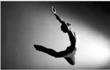
METZ 52x THE SLIM ONE