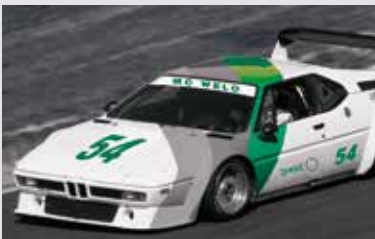
METZ 54x THE CLASSIC ONE