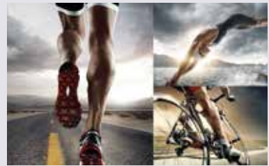
METZ 57x THE ALLROUNDER