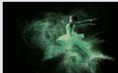
METZ 58xx THE PRECISE ONE