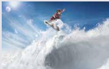
METZ 56x THE COOL ONE